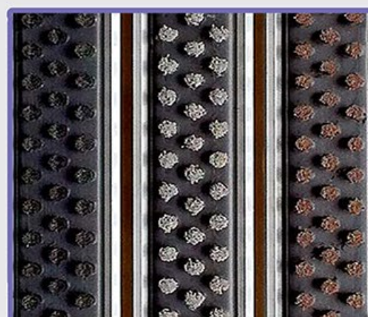
-40 до +70C

Луксозни навиващи се алуминиеви профили 6063 T6 Подобрен гумен релеф за задържане на едрата мръсотия Подходящи за лек, среден и натоварен трафик Пожарен клас: PN-EN 13501-1+A1:2010-Cfl - s1-трудно горими Антихлъзгащ клас: DIN 51130:2014- R11-мокет, R12-гума, R13-четка Подходящ за вграждане на всякакви входни зони и типове врати Профил: 22мм, мокет: 23мм, гума-23мм, четка 24мм Препоръчително поставяне на рампа или "L" обранза рамка Тегло приблизително: 12-20 kg/ m2 според типа вложка