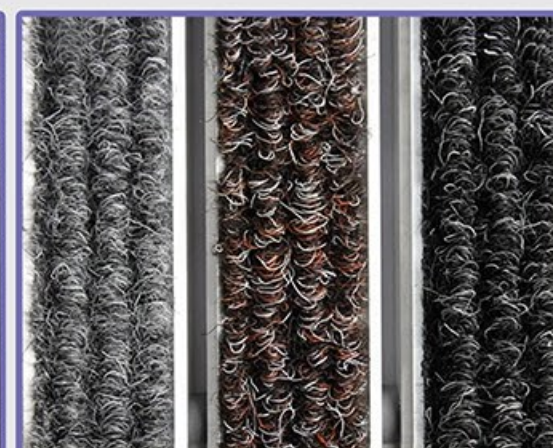
+5 до +70C